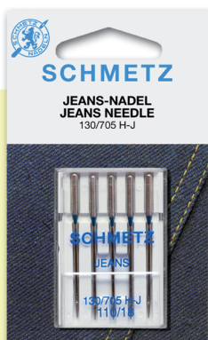
JEAN Tejidos duros y denim. Medidas: 14-16-18