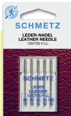
CUERO Y VINÍLICOS Cuero y materiales similares. Medidas: 14-16