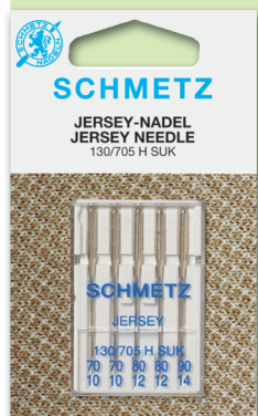
JERSEY Géneros elastizados. Medidas: 10-12-14