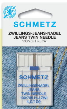
DOBLE DE JEAN Ideal costura doble en jean. Medida única: 16/4.0