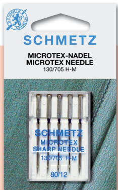
MICROTEX Microfibras, laminados y seda. Medidas: 8-10-12-14