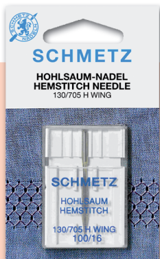
CALADO Crea texturas caladas. Medidas: 16-18