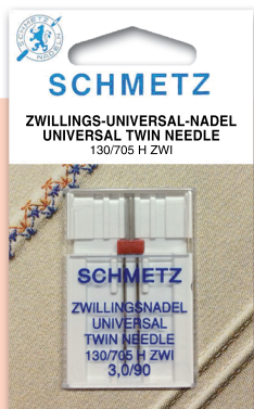
DOBLE AGUJA Decorativas y alforzas. Distancias: 2.0-2.5-3.0-4.0