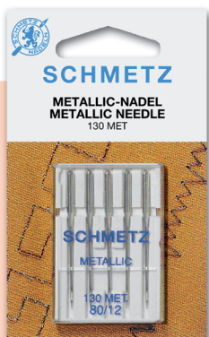
METALLIC Hilos metálicos y especiales. Medidas: 12-14