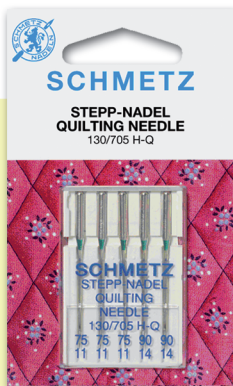
QUILTING Patchwork y quilting. Medidas: 11-14