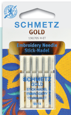
GOLD Ideal bordado. Mayor resistencia. Medidas: 11-14