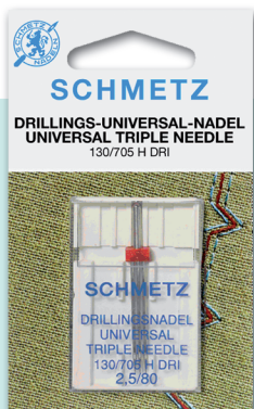
TRIPLE AGUJA Tres hilos diferentes. Distancias: 2.5-3.0