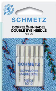
DOBLE OJO Ornamento con dos hilos. Medida: 12