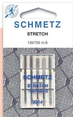
STRETCH Géneros muy elásticos. Medidas: 11-14