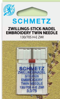
DOBLE PUNTA BOLITA Hilos metalizados/telas elásticas. Distancias: 2.0-2.5-3.0