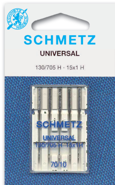
UNIVERSAL Tejidos varios. Medidas: 8-9-10-12-14-16