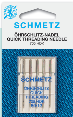
FÁCIL ENHEBRADO Universal. Ranura al costado del ojo. Medidas: 12-14